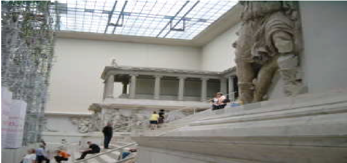
Bildauschnitte vom „Thron des Satans“, dem Pergamon-Altar (Pergamon-Museum in Berlin)

Gott lässt aber prinzipiell jedem Menschen, ausgenommen den von ihm direkt Auserwählten und Berufenen (siehe z.B. Offb 17,14 → Hebr. 3,1, Römer 11,7ff), die freie Glaubensentscheidung, auf der Basis der Verkündigung des Evangeliums bzw. Teilen davon. (Sobald etwas Zwang ist, hat es nichts mehr mit Glauben zu tun, wobei viele so an den „frommen“ Zwang gewöhnt sind, dass sie nicht mehr ohne leben können und eifersüchtig böseartig schauen, dass auch alle anderen Unterworfenen nicht aus dem Zwang ausscheren, siehe z.B. Katholizismus früherer Jahre oder der heutige Islam 5 in den Stammländern!)