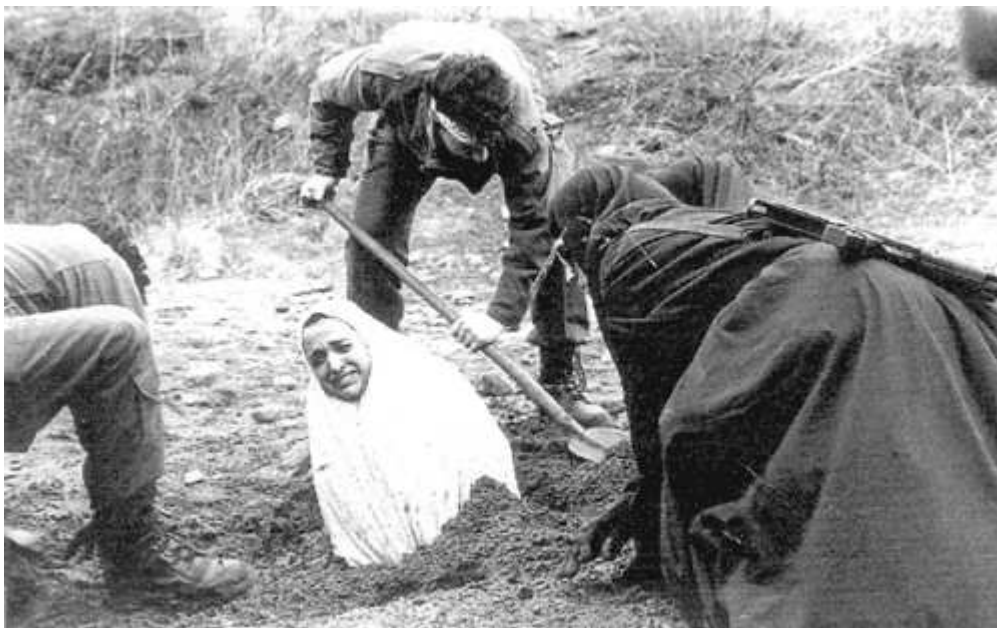
Eine iranische Frau wird zur Steinigung eingegraben...