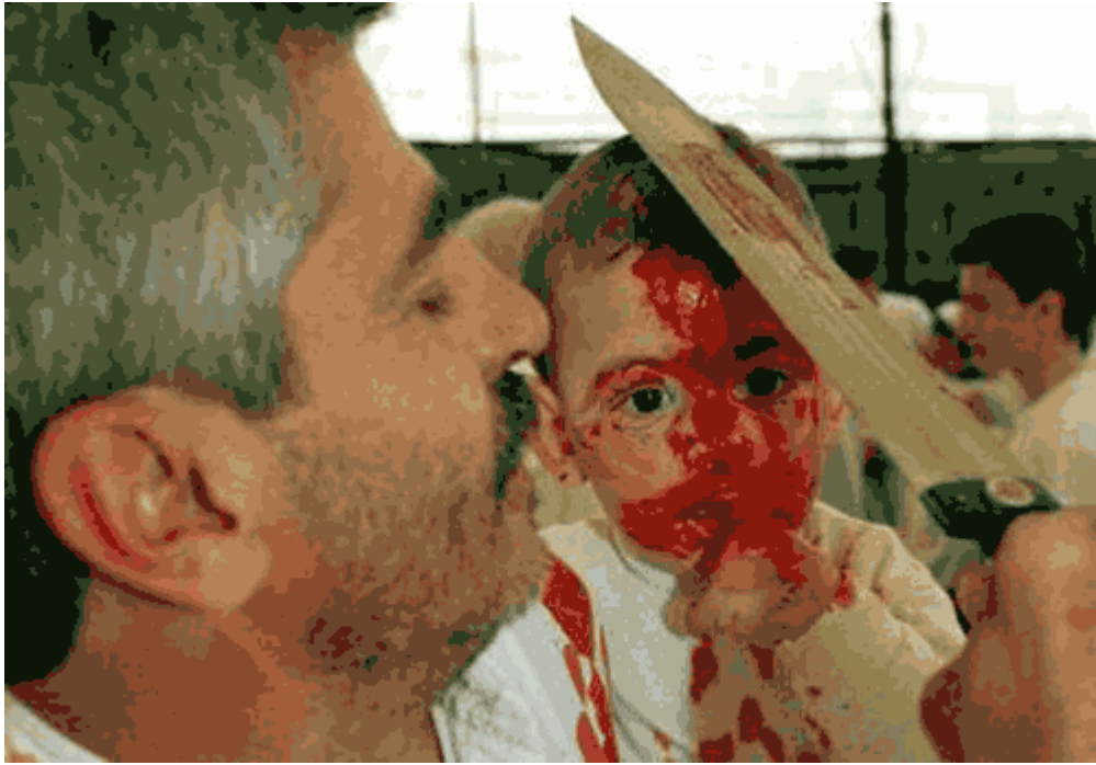
Kinder-„Aderlass“ am muslimischen Ashura-Fest im Libanon